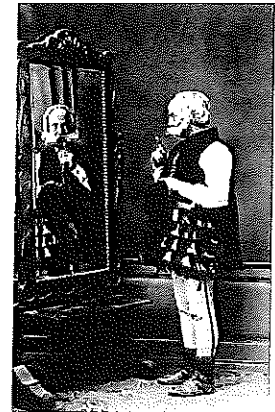
FREUDENREICH, Josip, ml.

Freudenreich [fro'jdenrajh], Josip, ml. , hrvatski glumac, kazališni redatelj i dramatičar (Nova Gradiška, 6. X. 1827 – Zagreb, 27. IV. 1881). Od 1845. nastupao je s hrvatskim i njemačkim kazališnim družinama u Zagrebu, Karlovcu, Varaždinu, Bjelovaru, Ptuju i drugim hrvatskim i slovenskim gradovima. U Zagreb je došao 1855. Sljedeće godine boravio je u njemačkom kazalištu u Temišvaru, odakle se vratio s rukopisom Graničara , prvoga hrvatskoga pučkog igrokaza, koji je postavljen 1857., a 1858. izvedena je njegova »čarobna gluma« Crna kraljica . Kada su ukinute hrvatske predstave, boravio je u Lavovu i Beču. Na poziv Dimitrija Demetra vratio se u Zagreb 1860. Nakon osamostaljenja hrvatskoga kazališta 1861. glumio i režirao, nastavio pisati i prevoditi, 1863. uveo operetu, a 1870., s osnutkom opere, postao naš prvi operni redatelj. Kao glumac isticao se u karakternim ulogama i kao komičar, ali mu je tadašnji repertoar nametao i herojske uloge: Harpagon (Molière, Škrtac ), Karl Moor (Friedrich Schiller, Razbojnici ), Dimitar Hvaranin (D. Demeter, Teuta ), Grga (u vlastitim Graničarima ) te različite uloge u igrokazima Ferdinanda Jakoba Raimunda i Johanna Nepomuka Nestroyea. Posebno važan zbog uvođenja žanra pučkog igrokaza, radio je na organizaciji kazališta i glumačkoj pedagogiji (učenici su mu među ostalima bili Adam Mandrović i Marija Ružička-Strozzi).